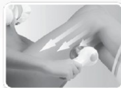
ΠΟΔΙΑ ΧΡΟΝΟΣ: 5-8 λεπτά