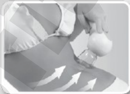
ΚΟΙΛΙΑ ΧΡΟΝΟΣ: 5-8 λεπτά