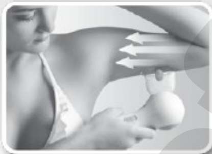
ΒΡΑΧΙΟΝΕΣ ΧΡΟΝΟΣ: 5-8 λεπτά

Αν θέλετε να κουράρετε αρκετά σημεία του σώματός σας, πάντα να ξεκινάτε από το πάνω σημείο που θέλετε να κουράρετε και μετά να συνεχίζετε προς τα κάτω. Με την κίνηση που υποδεικνύετε και ενώ σέβεστε τους χρόνους, χρησιμοποιήστε τη συσκευή κάθε δεύτερη μέρα μέχρι να είστε ικανοποιημένοι με τα αποτελέσματα. Μετά, μπορείτε να χρησιμοποιείτε τη συσκευή κάθε δεύτερη εβδομάδα για να διατηρήσετε τη φιγούρα σας.