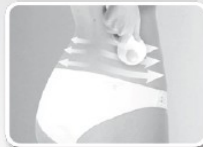
ΠΛΑΤΗ ΧΡΟΝΟΣ: 5-8 λεπτά